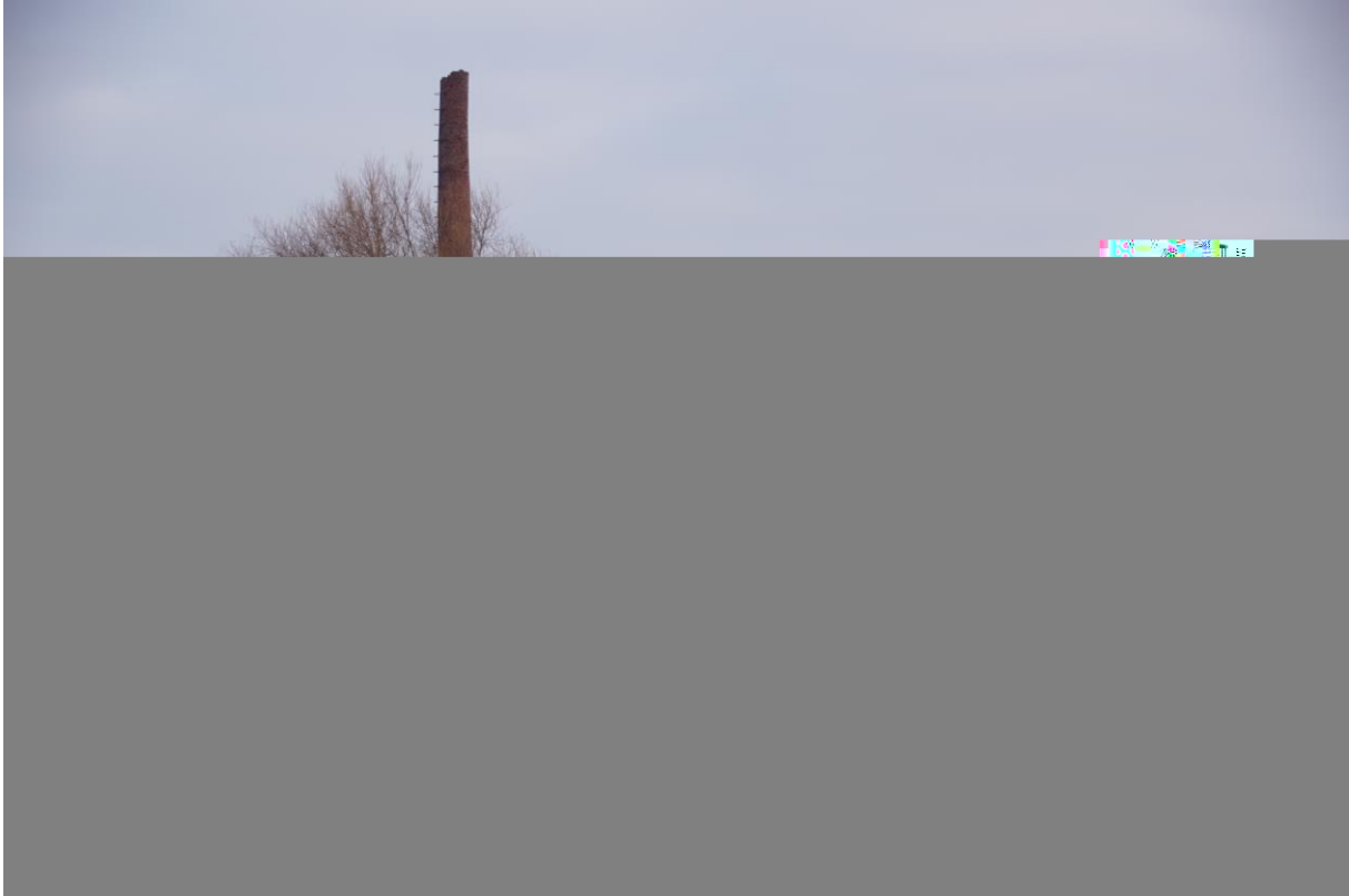
(tuinbouwkassen met schoorsteen en ketelhuis, De Vosholen Sappemeer; afb. ve).