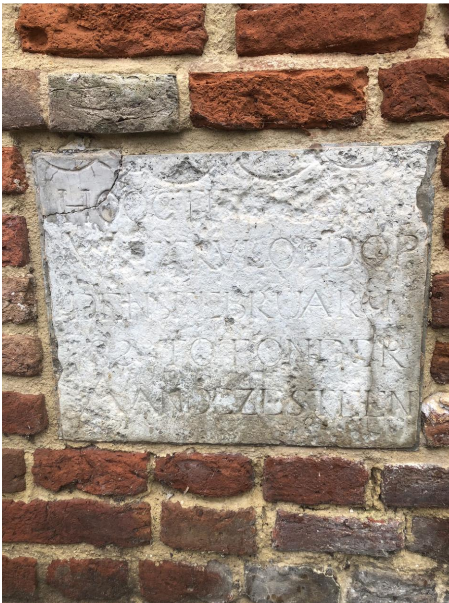
(afb. gevelsteen Smeepoort Harderwijk, ve).

Inmiddels is de expositie in het Stadsmuseum van Harderwijk beëindigd. In de tekst op een van de banners werd verwezen naar een aanwezige gevelsteen in de Smeepoort niet ver van het museum vandaan. Wie bij de Smeepoort staat ziet twee dingen: het huidige IJsselmeer op steenworpafstand en begrijpt dat het zeewater met gemak de binnenstad van Harderwijk werd ingestuwd. In de straten moet het water 1 meter hoog hebben gestaan.