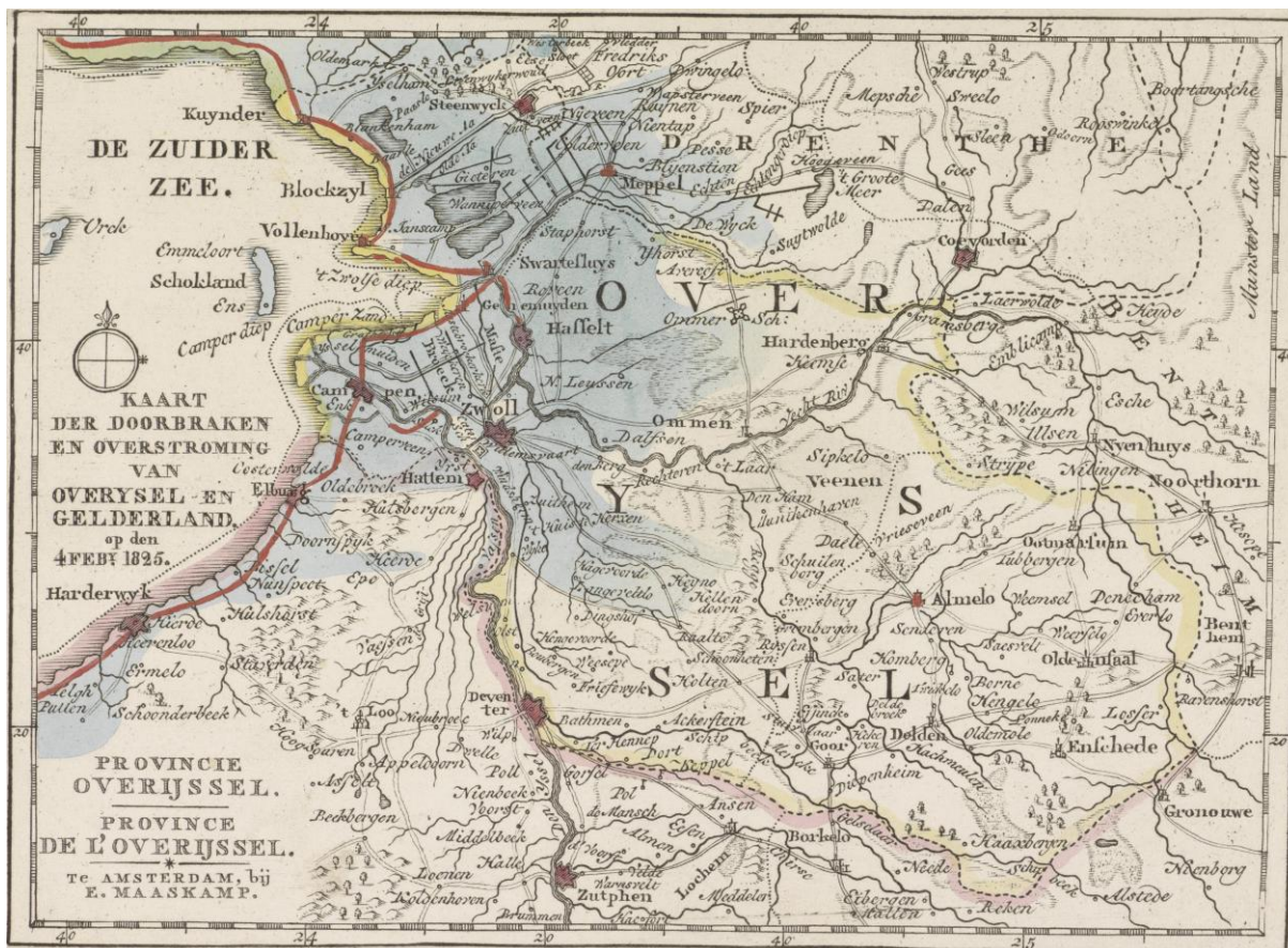
(overzicht van het rampgebied in Overijssel en Gelderland)