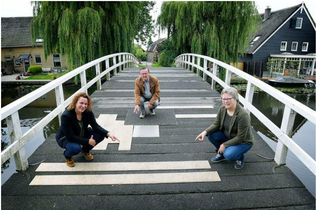
De houten Pinkeveersebrug

Jong heeft zich verplicht om de brug voor 25 jaar te onderhouden in zijn nalatenschap is opgenomen dat de brug ook door de volgende generatie De Jong zal worden onderhouden.