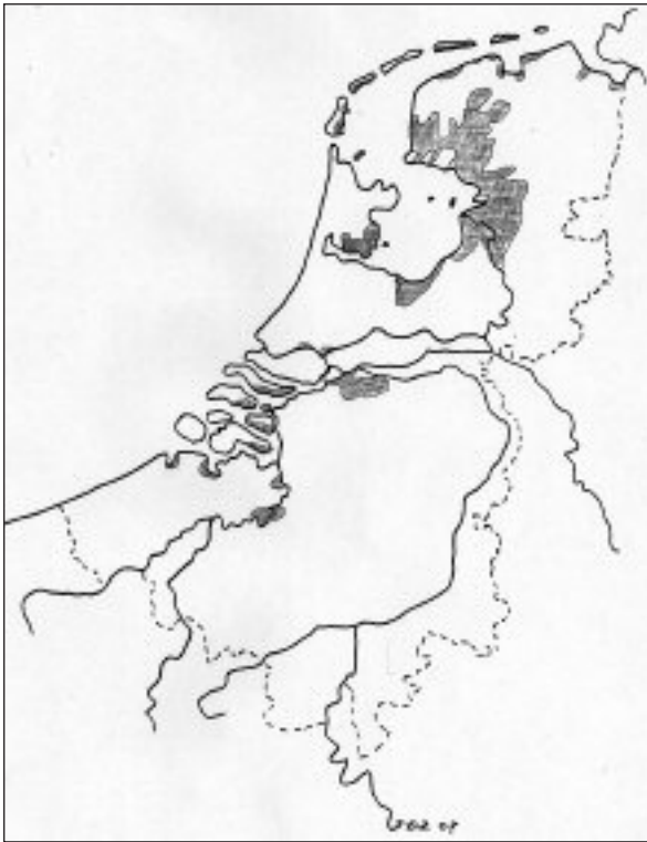
1. De in 1825 geïnundeerde gebieden (kaart door de auteur).