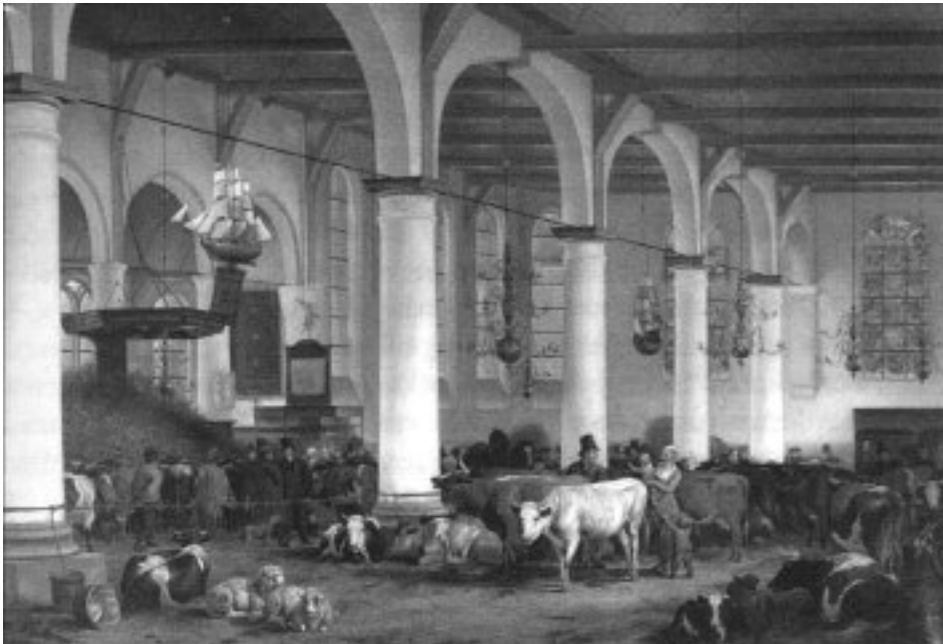
2. Het vee in de kerk van Oostzaandam tijdens de watersnood van 1825, schilderij van James de Rijk (1830) (uit: J. ter Pelk-wijk, Overijssels Watersnood. Een heruitgave van het verslag van de ramp van 1825 (Kampen 2002), p. xiii).

Koninkrijk der Nederlanden, zullende worden gehouden te Groningen op den 20 juni 1825 ingevolge programma van den 2 mei bevorens.’