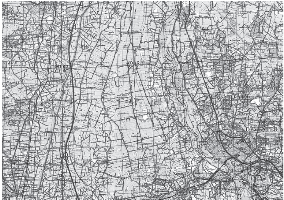
Afb. 3. Topografische kaart van het zuidelijk gedeelte van het waterschap met Terwolde, Nijbroek en Oene.

de bijbehorende lage gebieden (broeken) pas in ontginning waren genomen. 9 Deze gebieden waterden in de rivierkom af. Aan de oostkant op de oeverwal van de IJssel lag ook al een bestaande ontginning: Terwolde. Deze waterde waarschijnlijk via een oude IJsselloop, gelegen op de provinciegrens met Overijssel bij de buurtschap Welsum, af op de IJssel. 10 De tweede bepaling bood een alternatief. De gebieden ten westen en ten zuiden van de nieuwe ontginning konden ook gebruik maken van de weteringen van Nijbroek, maar moesten dan bijdragen in het onderhoud. Voor deze laatste oplossing werd niet gekozen. De derde en laatste bepaling betreft de dijk langs de IJssel. Hierop wordt later in dit artikel dieper ingegaan.