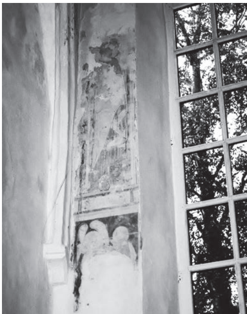
Afb. 2. Middeleeuwse muurschildering in de kerk van Nijbroek. Elf jaar na de uitgifte werd Nijbroek een eigen parochie (1339). De muurschilderingen werden eind jaren zestig van de twintigste eeuw aangetroffen bij de voorbereiding van restauratiewerkzaamheden.

In de uitgiftebrief van 1328 komen drie bepalingen voor die van belang waren voor de regeling van de waterstaat. De eerste bepaling stelde dat de andere dorpen hun water om het nieuwe richterambt Nijbroek heen moesten leiden. In een volgende bepaling werd vastgelegd dat als de aangrenzende dorpen gebruik wilden maken van de afwatering van Nijbroek, zij daarvoor een bijdrage moesten leveren. De eerstgenoemde bepaling had grote consequenties, want de andere dorpen maakten nieuwe waterstaatkundige werken nodig in de vorm van aanleg van weteringen en kaden. De nieuwe ontginning lag midden in de rivierkom. Ten westen ervan lagen reeds de dorpen Vaassen, Emst en Epe, waarvan