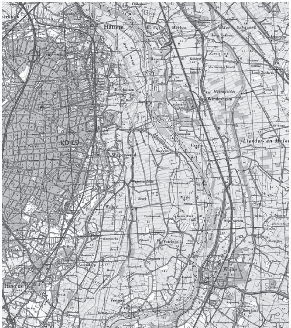
Afb. 5. Topografische kaart van het noordelijk deel van het waterschap met Heerde (met Veessen en Wapenveld) en Vorchten en de uitwatering in de Dwarsdijk tussen Werven en Hulshbergen (Wapenveld).

de grond aan de dijk grensde. Overigens was dit niet beperkt tot de individuele grondeigenaren maar ook van toepassing op het niveau van dorpen en buurtschappen. Dit was in de veertiende eeuw een betrekkelijk nieuwe ontwikkeling in de verhoefslaging van het dijkonderhoud, dat wil zeggen het omslaan van het dijkonderhoud of de kosten daarvan over alle grondbezitters in plaats van de aangelanden. Het is onduidelijk of deze bepaling gezien moet worden als een verwijzing naar een bestaande dijk langs de IJssel of dat die dijk nieuw was. In ieder geval moesten het dorp en de bewoners van Nijbroek bijdragen in het onderhoud ervan.