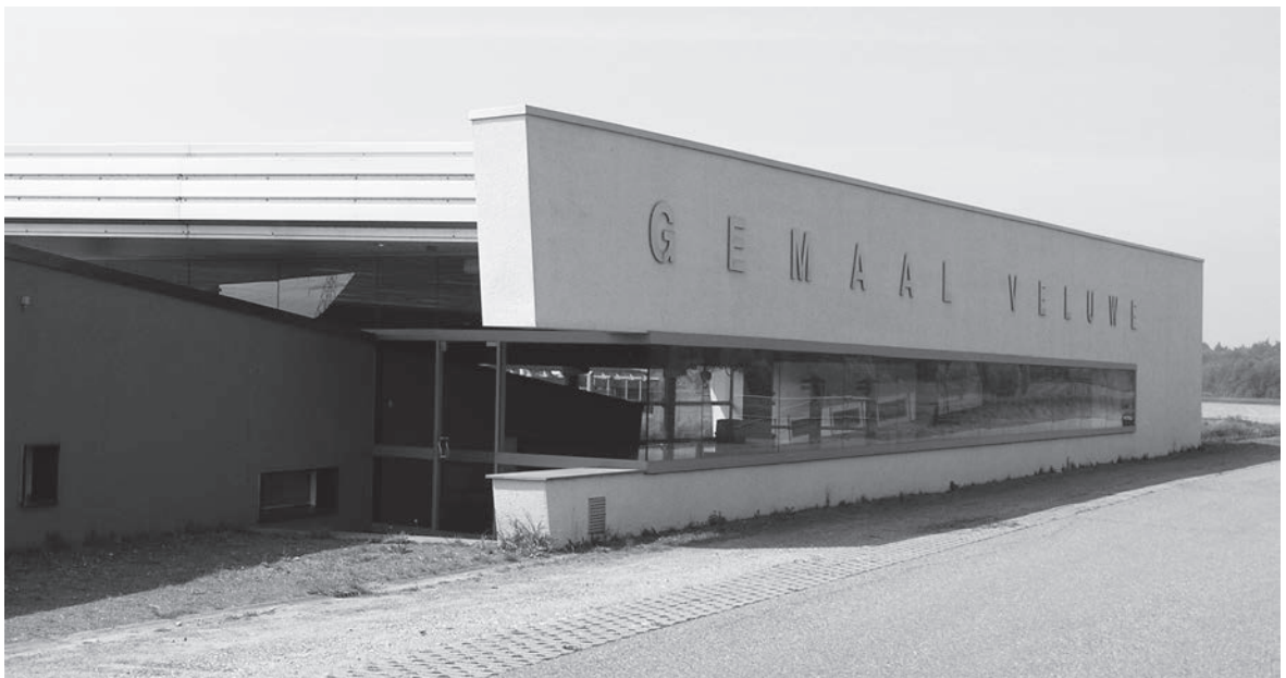
Afb. 7. Het nieuwe gemeal Veluwe (sinds 1999).

De vorming en afronding van het waterschap is veel moeizamer verlopen dan elders in het Gelderse rivierengebied. Mogelijke oorzaak is de eilandenstructuur van de waterschappen in deze regio, die gekenmerkt werd door min of meer gesloten dijkkringen. Ook de uitwatering viel daarbij onder jurisdictie van het waterschap. Daarentegen was op de Veluwe de uitwateringssituatie in de dijkrechten van 1370 en 1470 niet geregeld. Het waterschap Veluwe kreeg vooral hierdoor pas in de zestiende eeuw zijn uiteindelijke vorm. In 1838 werd het ingepast in het waterschapsreglement van de provincie Gelderland. Dat bracht grote veranderingen in organisatie en taken, maar de omvang van het gebied bleef hetzelfde. Het waterschap verdween als zelfstandige organisatie van de kaart met de oprichting van het waterschap Oost Veluwe in 1984. Dit fuseerde op zijn beurt in 1997 in het waterschap Veluwe. De volgende reorganisatie is momenteel reeds een besloten zaak. Op 1 januari 2012 gaan de ambtelijke organisaties van de waterschappen Veluwe en Vallei en Eem samen waarna op 1 januari 2013 de bestuurlijke fusie zal volgen (afb. 7).