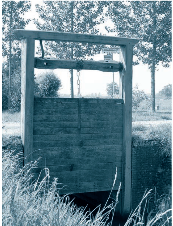
Afb. 6. Gerestaureerd zeventiende of achttiende-eeuws sluisje in de Vloeddijk bij Nijbroek.

Honderd jaar later, in 1470, werd een nieuw dijkrecht uitgevaardigd, op verzoek van de betrokken dorpen. Vergelijking van beide dijkrechten laat zien dat in hoofdzaken – be-