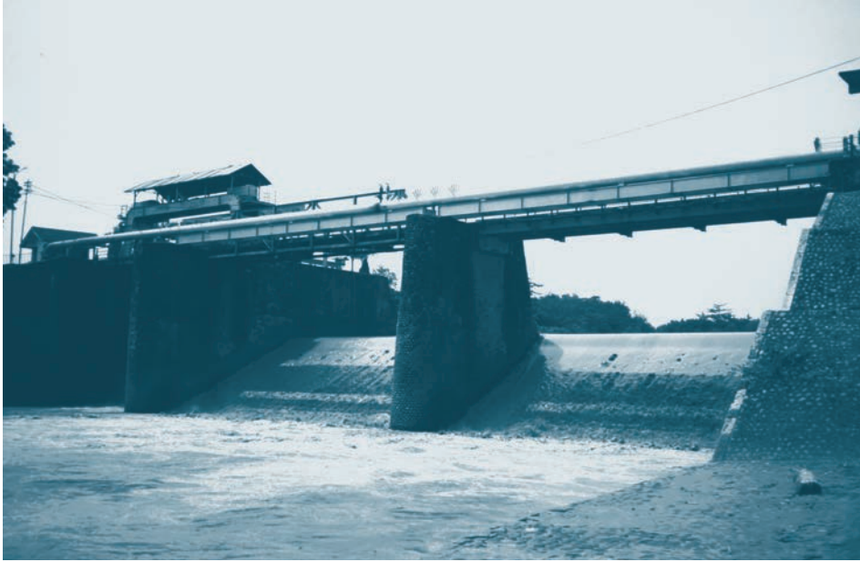
Afb. 5. Een aangepaste stuw uit de koloniale periode op Java.

was deze mening toegedaan en hij handhaafde de inhoud van het basismateriaal en de ontwerp opdrachten. Waar nieuwe inzichten beschikbaar kwamen, werkte hij die uit in extra studiemateriaal. Aangezien de meeste studenten de cursus waar dat extra materiaal aan de orde kwam niet volgden, bleef de irrigatiebenadering uit Nederlands-Indië de Delftse ingenieurs tot laat in de twintigste eeuw vormen.