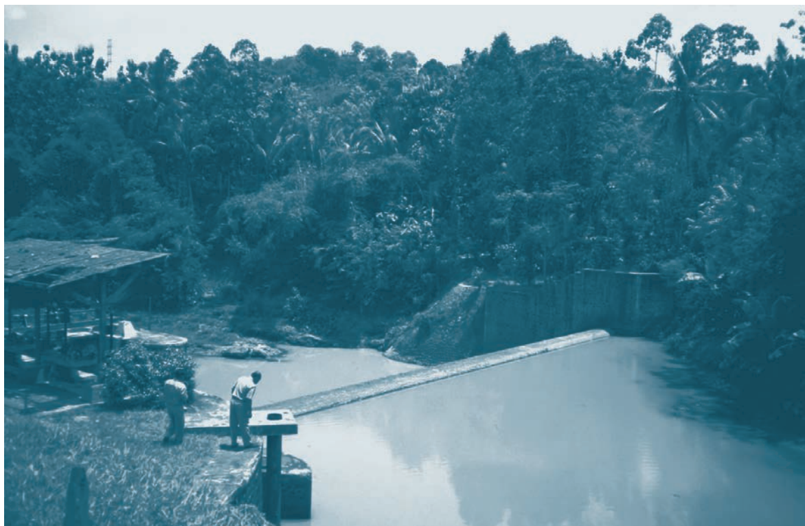
Afb. 2. Een nog steeds in gebruik zijnde stuw uit de koloniale periode in Lampung, Sumatra.