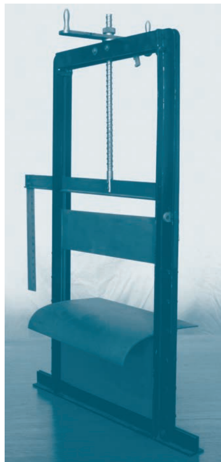
Afb. 4. Schaalmodel van een Romijnoverlaat als gebruikt in het onderwijs. Collectie Technische Universiteit Delft.

Deze student concludeerde tevens dat een capaciteitskromme zoals de Tegalse niet nodig was in zijn Ethiopische geval, aangezien alle eenheden gelijk van grootte waren en er overal suikerriet verbouwd werd. 57 De meeste studenten die een niet-Indisch ontwerp hadden lijken het met hem eens te zijn: er zijn binnen deze groep zes studenten die rechtstreeks een capaciteitskromme gebruiken. In een ontwerp voor Syrië construeert een student een eigen curve, waar een andere gewoon de Tegalse lijn hanteert. Er is een student die in zijn ontwerp voor een Ethiopisch systeem de Tegalse lijn toepast omdat “de vakgrootten nogal uiteenlopen”. 58 In een ontwerp voor het Kano-systeem, Nigeria, is er weer een student die de Tegalse lijn zonder meer toepast, maar er is ook een student die de curve wel gebruikt, maar opmerkt dat “deze formule gebaseerd is op het verbouwen van hoofdzakelijk rijst”, iets wat in zijn systeem niet het geval was. 59 Student Meijer gaat nog iets verder: hij past diezelfde curve toe in Ethiopië, hoewel hij weet dat dat eigenlijk niet correct is, aangezien “geen praktijkgegevens bekend zijn van het onderhavige gebied en voorts rekening moet worden gehouden met verbouw gedurende 6 maanden van tweede gewassen door de bevolking”. 60 Meijer nam aan dat “de toepassing van de bedoelde lijn in elk geval veilig is”. 61 Een aan kanaalcapaciteiten gerelateerde kwestie is de grootte van de tertiaire vakken. In Nederlands-Indië was hiervoor 140 hectare