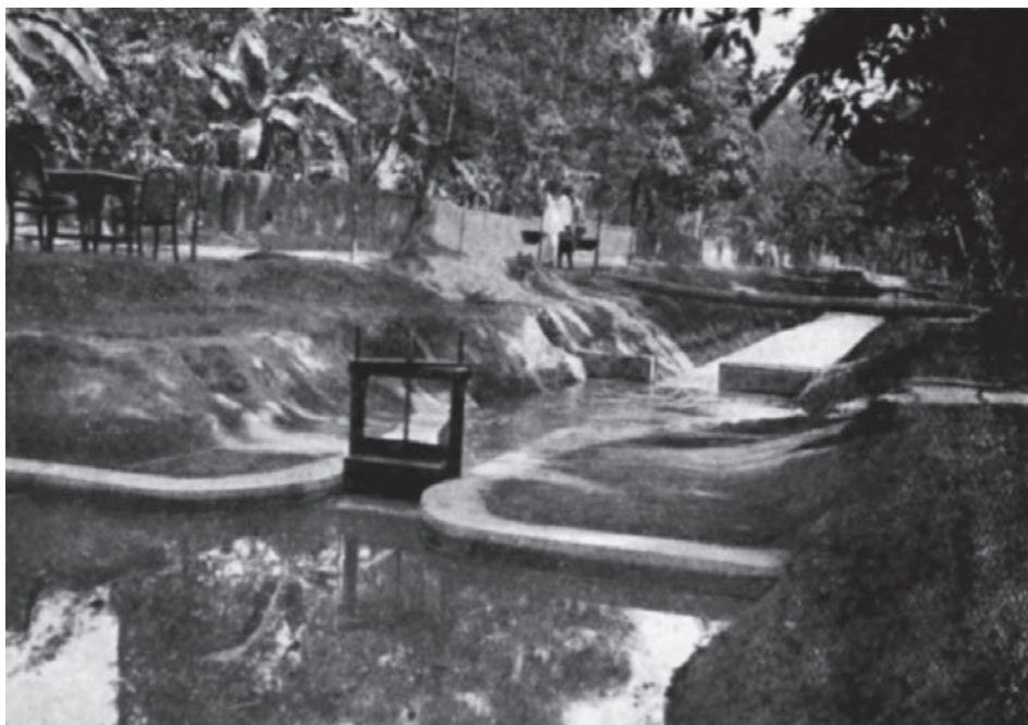
Afb. 1. Een koloniaal regelwerk. Overgenomen uit P. de Gruyter, 'Een nieuwe aftap- tevens meet- sluis en de resultaten van een proef met een dergelijk kunstwerk', De Waterstaats-ingenieur 1 (1926), 1-15.