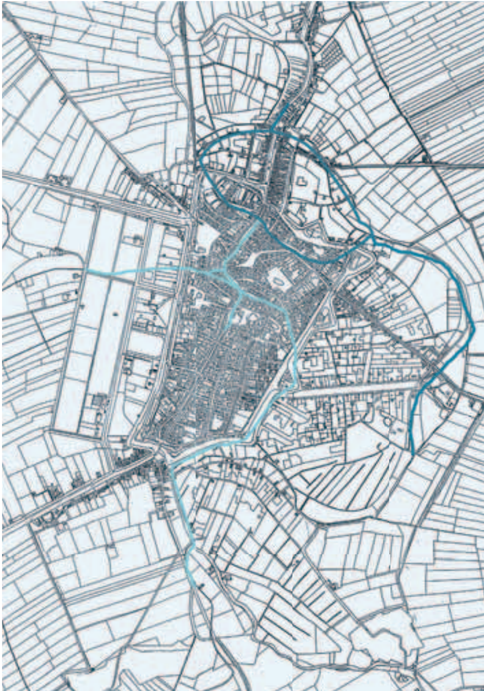
Afb. 2. Pre-kadastrale minuutplan van de stad Utrecht met omgeving, 1832. Met de vermoedelijke loop van de Rijn (lichtblauwe lijn) en die van de Vecht (donkerblauwe lijn), in de twaalfde eeuw voor de doorgraving van de Oudegracht Noordzijde en de Weerd circa 1165 en de stormramp van 1170.

het nedereind altijd het noordelijk deel, stroomafwaarts ten opzichte van het Domplein en aflopend naar de Zuiderzee, heeft betekend, moet ik hem daarin wel gelijk geven.