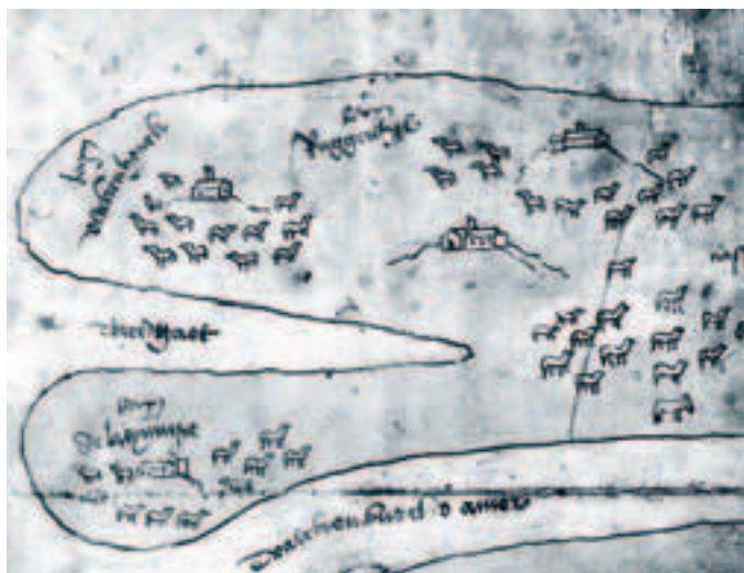
Afb. 3. Schapen en bewoonde stellen op de gorzen Ruijgenhil en Heijningen in 1542. De schuine rechte lijn rechts is de grens tussen gronden onder Breda en Bergen op Zoom. Fragment uit de kaart van het eiland Overflakkee door een onbekende kaartmaker. Nationaal Archief Den Haag, VTH verzameling binnenlandse kaarten Hingman, nr. toegang 4.VTH inv.nr. 2210.