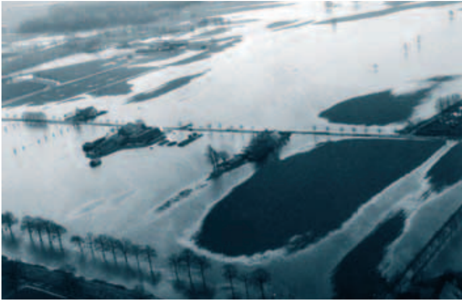
Afb. 3. Wateroverlast bij de Laapeereweg in Leusden-Asschat ten oosten van het Valleikanaal na zware regenval in maart 1998. Het Eemmoeras is weer even terug.

in de Eem groeiden. Volgens de stad strekte de grens van de stadsvrijheid “so weyt als in die Eem een witte swaen gesien coste worden”. In 1580 maakte het stadsbestuur bezwaar tegen de plannen van Bunschoten en Eemnes om dijken en sluizen aan te leggen in “haer [Amersfoort] luyder ryevire van de Eem”. Dat ‘Eem’ en ‘zee’ blijkbaar inwisselbaar waren, blijkt nog in 1643 uit de uitspraak van een man die op de Bunschoter dijk woont: hij verklaart dat Amersfoort aanspraak maakt op de Eem “soo verre men een witte swaen in see conde sien”. 16