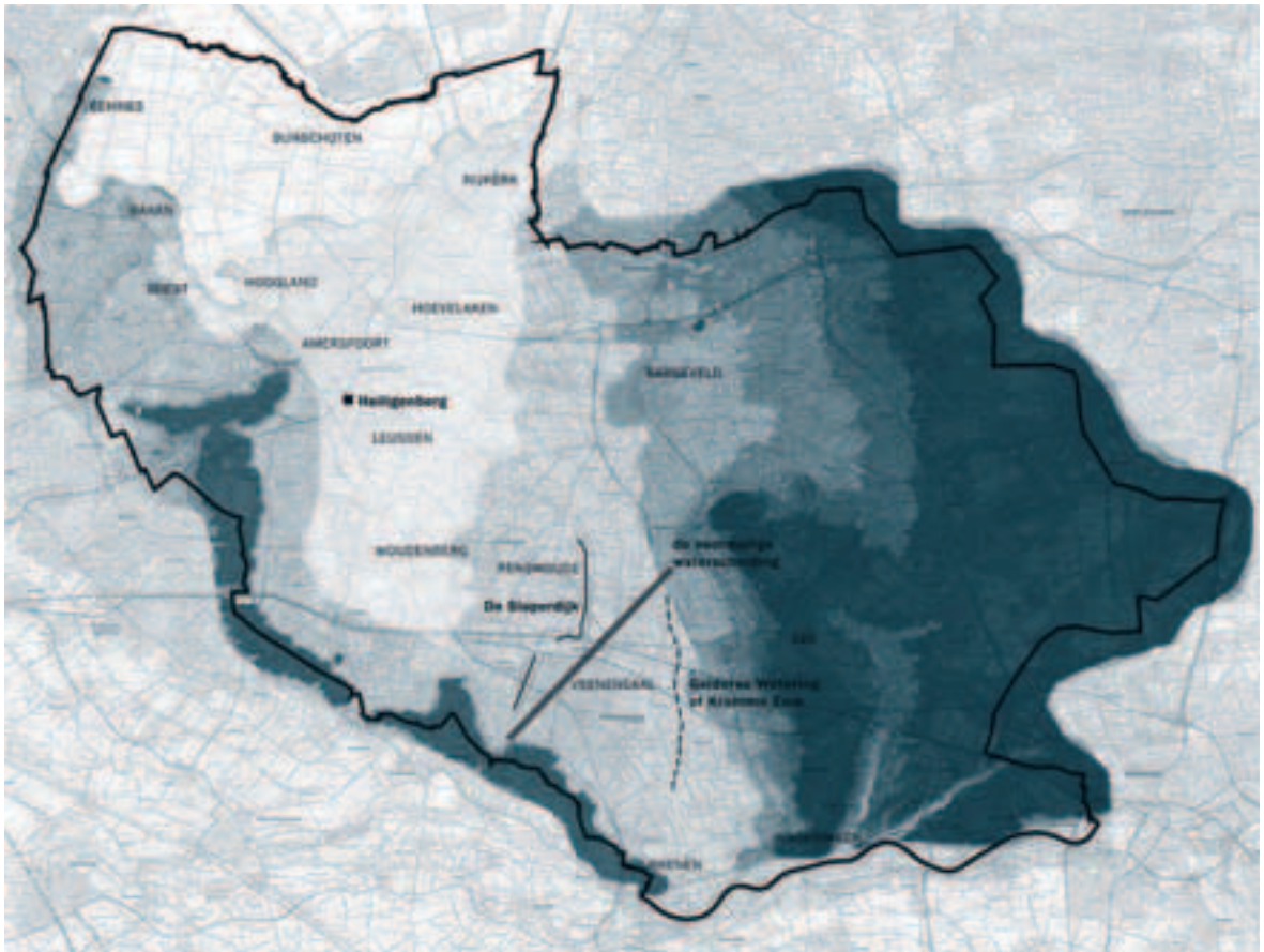
Afb. 1. AHN-hoogtekaart van het Vallei- en Eemgebied. Het Eemdal reikte tot bij de waterscheiding en zelfs nog zuidelijker tot in de meden bij Ede. De Gelderse Watering daar droeg oorspronkelijk de naam 'Kromme Eem'.

sen en zij vormden de uitgangspunten voor kleine ontginninkjes. Voorbeelden daarvan zijn de kleine polderdijkes, gevormd vanuit boerderijen op dicht bij de stuwwal van Baarn en Soest gelegen zandhoogten, die toebehoorden aan het klooster Elten (dat ook het Gooi in bezit had) en die daarom al uit de tiende eeuw moeten dateren. 11 Zij zijn pas in de negentiende eeuw in een groter polderverband gebracht.