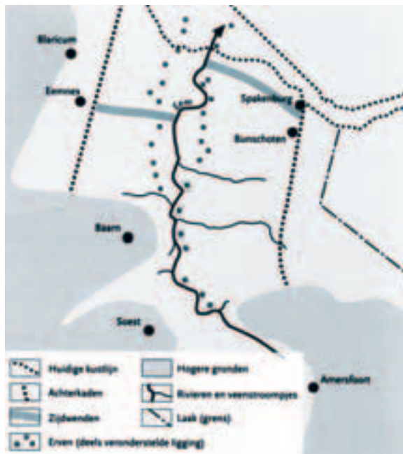
Afb. 8. Weergave van de veronderstelde oudste bewoningsfase van Eemland volgens Vervloet. Vervloet, 'Nederzettings- en ontginningsgeschiedenis', 21.

gebied zelf ziet hij “uitsluitend boven op de bergjes die vanaf Eembrugge, in zuidelijke richting gaand, in een rij langs de Eem liggen”. Daar zouden al in de prehistorie mensen hebben gewoond, wat zou verklaren dat de Germaanse naam ‘Eem’ in gebruik is gebleven. Hij plaatst het begin van de ontginning van het veengebied dus “vóór omstreeks 1100 na Christus” en die van Bunschoten (en Eemnes) “in het laatste kwart van de twaalfde eeuw”, maar hij legt niet uit waarop hij deze dateringen baseert. Aangenomen mag worden dat de eerste bewering teruggaat op het boek van Maris. Haar datering is echter, zoals Dekker heeft aangetoond, “een slag in de lucht”. 47 De tweede datering moet wel berusten op de boven vermelde oorkonde van 1203.