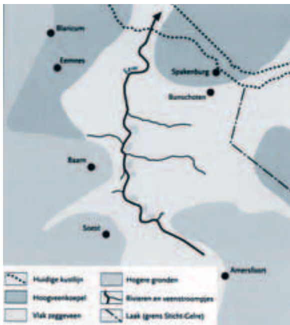
Afb. 7. Schematische kaart van het landschap in Eemland vóór de ontginning volgens Vervloet. Vervloet, 'Nederzettings- en ontginningsgeschiedenis', 17.