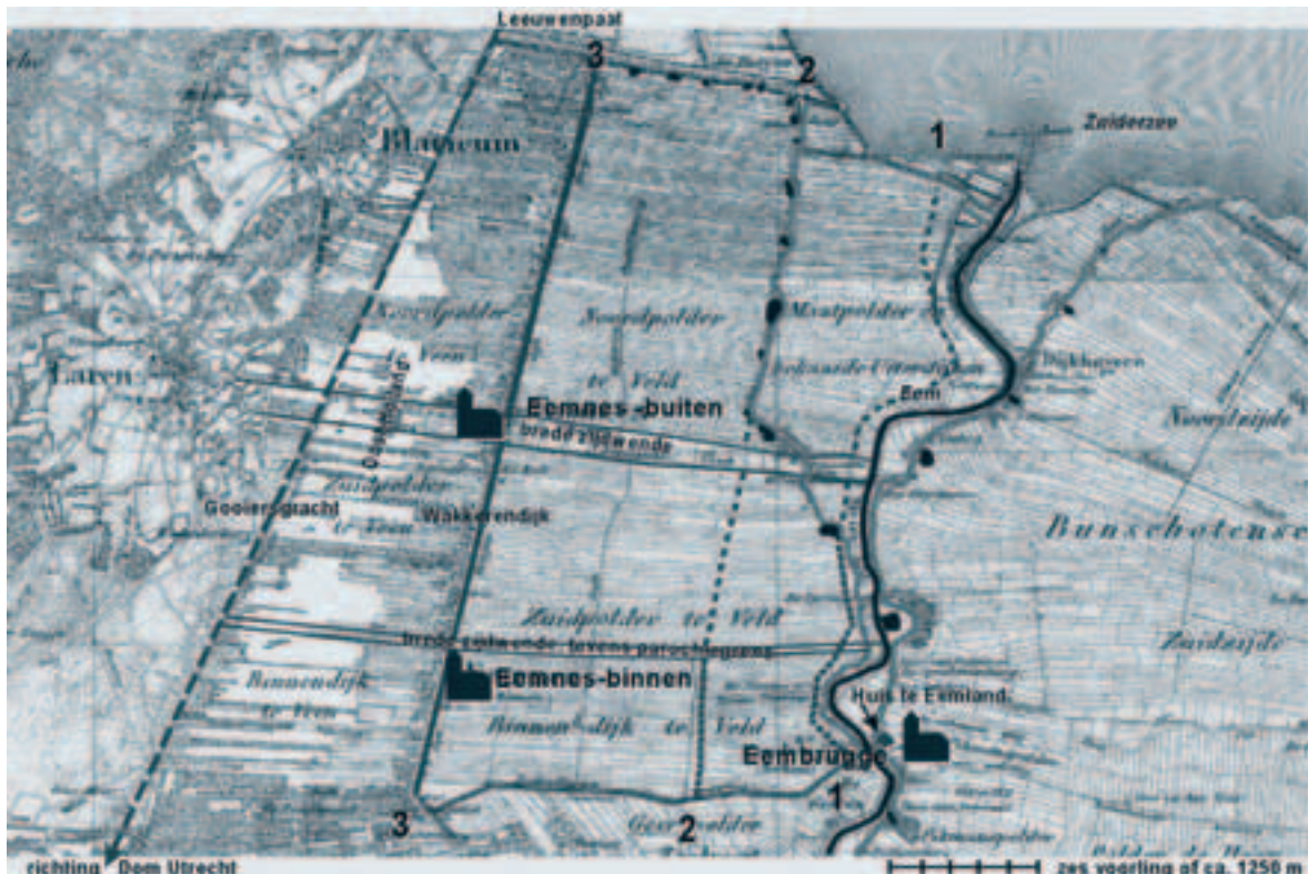
Afb. 10. De lijnen van lineaire bewoning in de eerste en tweede fase van de door De Bont veronderstelde ontginning van Eemnes en de oudere z.g. “smalle brede zijdwende” ten noorden van Binnendijk, weergegeven op de midden-negentiende-eeuwse topografische kaart. De Bont, ‘Twee vechten om de Eem’, 220 (afb. 6).

Hij veronderstelt “dat mogelijk een ‘locator’ (ministeriaal van de bisschop?) bij de inrichting van het Eemnesser cultuurlandschap beloond werd met het restgebied in de veenontginning: de noordelijke brede zijdwende”. 60 Dit idee is volkomen uit de lucht gegrepen, want een dergelijk figuur komt in geen enkele middeleeuwse bron over Eemland voor.