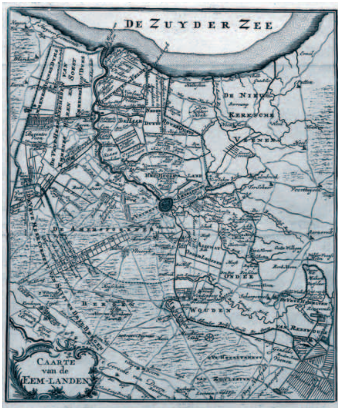
Afb. 2. 'Caarte van de Eem-landen', kopergravure uit de Reisatlas De Zeven Vereenigde Provintien, uitgegeven door Hendrik de Leth te Amsterdam tussen 1740 en 1772. Particuliere collectie.