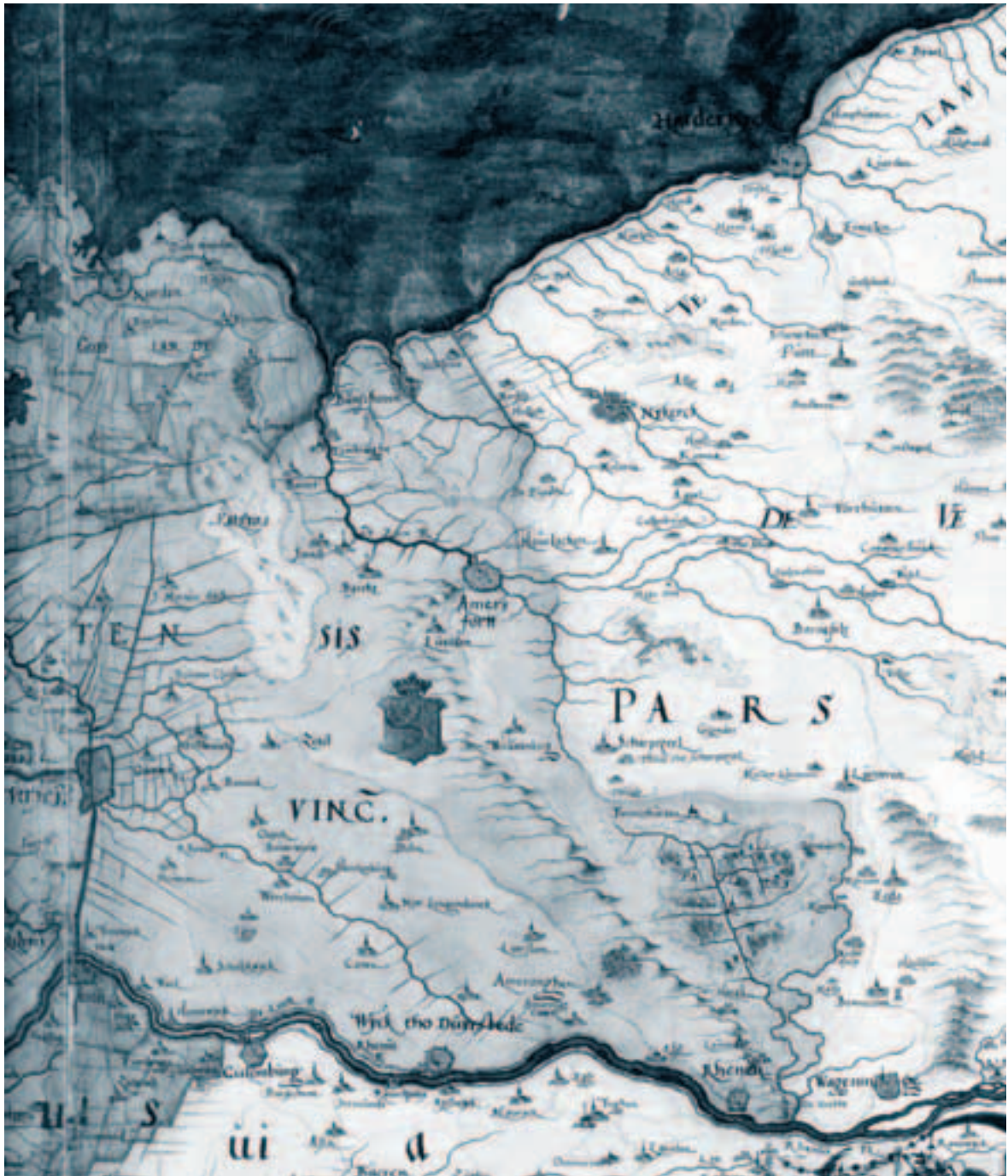
Afb. 4. Detail uit de kaart 'Superioris Hollandiae descriptio cum episcopatum Traiectensis et Geldriae parte inferioris' van Christiaan sGrooten, circa 1592. Hierop zijn de brede Eemmonding ten noorden van Baarn en Bunschoten aan de oostzijde van een bijna even breed riviertje ten oosten van de Eem te zien. In het zuiden is het turfwinningsgebied tussen de Emminkhuizerberg en Rhenen/Wageningen afgebeeld. Uit: H.P. Deys, De Gelderse Vallei. Geschiedenis in oude kaarten (Utrecht 1988) nr. 217 (afbeelding op de binnenzijde van de kaft).

gemeenschapsvoorziening. De Veendijk, nu de Oostdijk bij Spakenburg, was eigendom van het 'gemeenland', de gemeenschap van grondeigenaren die zich als groep verplicht had voor het onderhoud te zorgen. In principe werd dat bekostigd uit de opbrengst van verpachting van de zijdwende, de zijkade van de oorspronkelijke ontginning waarvan de naam nog voortleeft in de straatnaam Zuidwenk. Zijdwenden zijn altijd eigendom van het