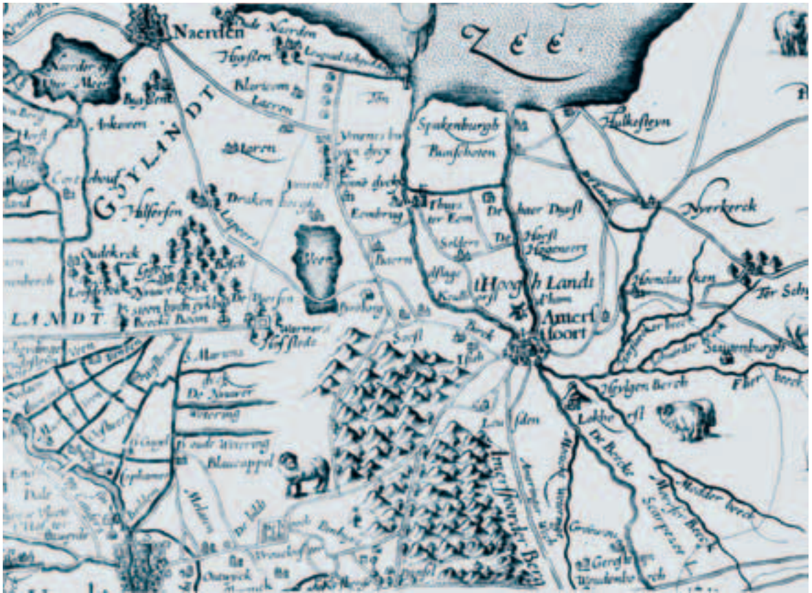
Afb. 5. Anonieme kaart van de Provincie Utrecht, gedrukt door P. Kaerius in 1616 (Topografische Atlas 40). Deze kaart gaat terug op een eveneens anonieme manuscriptkaart vervaardigd rond 1580 (Topografische Atlas 6). Hierop staat duidelijk aangegeven dat Bunschoten en Spakenburg aan de oostkant van de Spakenburgergracht liggen, die bijna nog breder is getekend dan de Eem zelf. Dat de gracht op de kaart doorloopt tot aan Amersfoort komt waarschijnlijk doordat men via de Neerduisterwetering (de vroegere Haarsaterdrecht en Zeldrecht) van Bunschoten naar Hoogland kon varen. De Westpolder van Bunschoten lijkt een eiland te zijn. Het Utrechts Archief, Topografische Atlas nrs. 40 en 6, zie Dekker en Mijnsen-Dutilh, Eemlandsche Leege Landen, 90-91.

gemeenland en blijven dat meestal tot in de tijd dat er schriftelijke bronnen over grondeigendom zoals belastingregisters zijn. De eigendom van de zijdwende van Bunschoten is in de zestiende eeuw met de onderhoudsplicht voor de Veendijk en de andere gemeenlandswerken overgegaan op het Heemraadschap van de Veendijk.