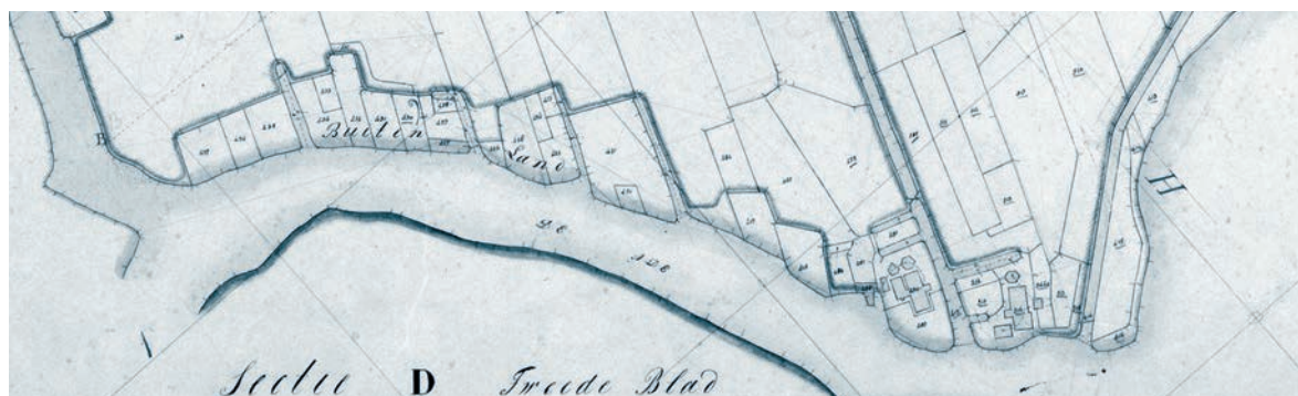
Afb. 4. Kadastrale minuut 1832, Alkemade, Sectie A blad 03. Onderaan de voormalige Wendeldijkshoek.

In 1297 wordt de Wendeldijk genoemd als graaf Jan I aan het klooster van Leeuwenhorst een uiterdijk 55 van de Wendeldijk schenkt, grenzend aan land dat het klooster al in bezit had. 56 Ook deze vermelding zou op hetzelfde eiland betrekking kunnen hebben omdat uit een kaartboek uit het begin van de zeventiende eeuw blijkt dat de abdij op dit eiland een perceel land in bezit had dat toen aan een poel gelegen was (afb. 5). 57 Op 6 juli 1308 gelast graaf Willem III de baljuw van Rijnland het klooster in het bezit van de uiterdijk te handhaven tegen eenieder “uten kercspele ende ute ambochte van Warmonde of anders”. 58 Ook deze vermelding sluit aan bij een Wendeldijk gelegen op het eiland omdat diverse percelen naast dit eiland tot het ambacht Warmond behoorden.