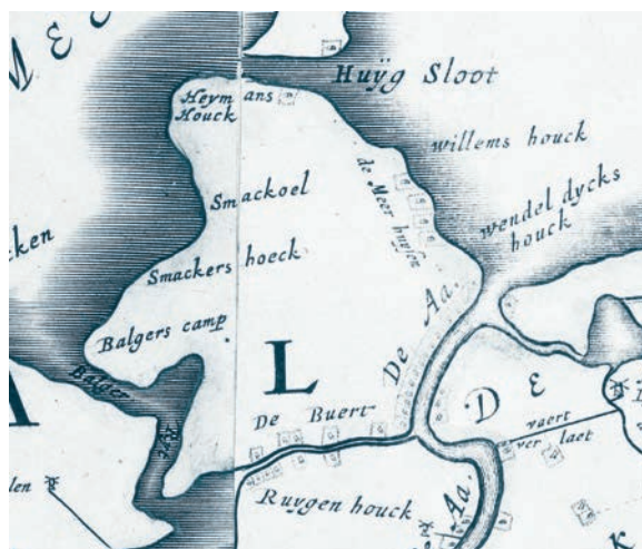
Afb. 3. Vermelding ‘wendel dijcks houck op het eiland ‘na de buurt’. Detail uit de overzichtskaart van Rijnland uit 1647.

Het Oud Nederlands Woordenboek kent aan ‘wendel’ de betekenis ‘bocht’ toe. 53 De Wendeldijk zou zijn naam dan aan deze ‘hoek’ of bocht in de dijk kunnen ontleen, vergelijkbaar met de middeleeuwse naam Wendelnesse voor Puttershoek. 54 Een alternatieve verklaring voor de naam Wendeldijk volgt uit de oudste gedetailleerde kaart van het eiland, de kadastrale minuut van 1832 (afb. 4). Op het dan al een aantal eeuwen ingepolderde eiland slingert een deel van de dijk nog steeds achter een aantal buitendijkse percelen. Misschien bestond deze situatie ook al in de middeleeuwen op het toen veel drukker bewoonde eiland en boden deze percelen toen plaats aan huizen van vissers of scheepswerven.