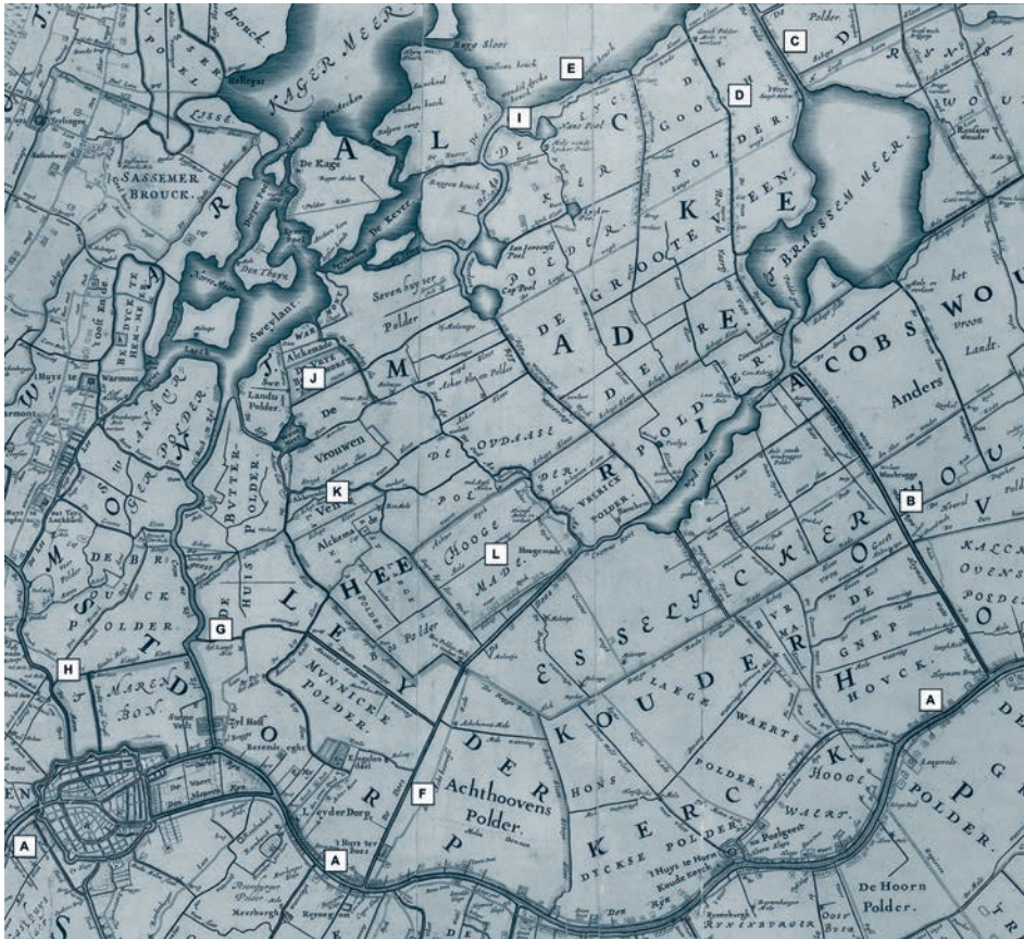
Afb. 1. Deel van de overzichtskaart van Rijnland uit 1647. A = Rijn; B = Heimans- of Woudwetering; C = Oude Wetering; D = Goog; E = voormalige Leidse Meer; F = Does; G = Zijl; H = Mare. I = Wendeldijkshoek; J = Vrije Boekhorst; K = Vrouwenne of Vrouwenveen; L = Hoogmaade.

wetering lopende Goog ziet hij als de derde wetering. 8