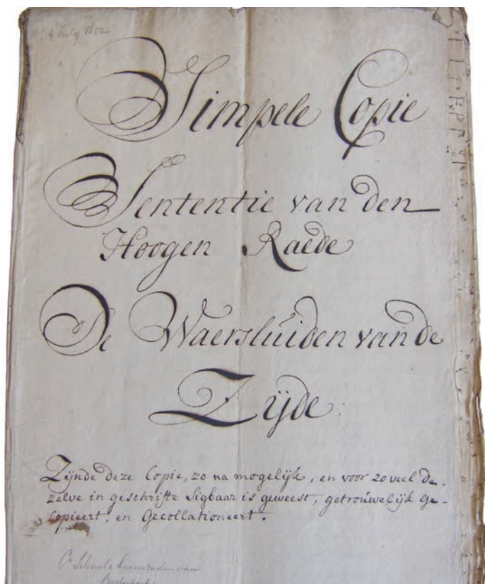
Afb. 4. Dekblad van een sententie van de Hoge Raad inzake een proces tussen de waerslieden van De Zijde versus schout en schepenen Lekkerkerk inzake overlast van Lekkerkerks maalwater, 9 juli 1652. Kopie sententie Hoge Raad.

betreffende waersman twee jaar later een van zijn boerderijen verkopen in verband met belastingschulden.