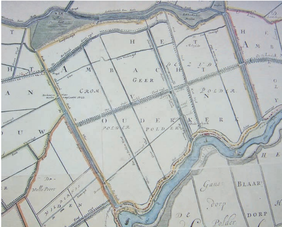
Afb. 3. Kaart polders Zijde, Cromme en Geer, Ouderkerk aan de IJssel (noorden onder). Het polderschap is geel omrand. De Hollandse IJssel is de rivier die van noord naar west stroomt. Rechts onder het midden stroomt de watergang van de gecombineerde polder zelf IJsselwaarts. Het dorp Ouderkerk ligt langs de dijk rond het punt waar die watergang de IJssel nadert. Naar: detail kaart Krimpenerwaard van Johannes Leupenius, versie 1792.