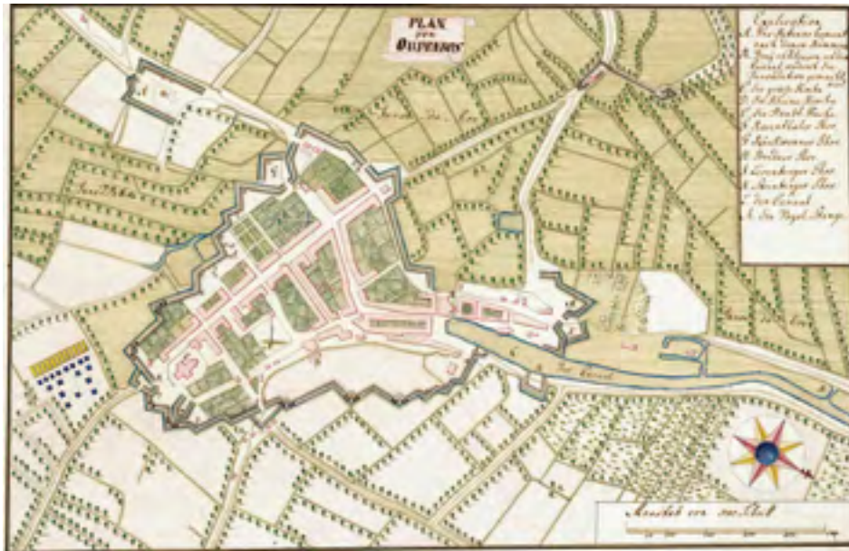
Afb. 6 . Kaart van de vesting Oudenbosch in 1747. Riksarkivet Stockholm, Krigsarkivet, Utländska SFP Holland Oudenbosch no. 1.