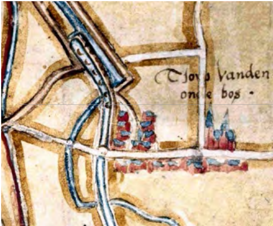
Afb. 4. Op de Gastelse Kaart uit 1565 zien we ten westen van het dorp Oudenbosch de Zoute Vaart, de Verse Vaart en het in 1332 gegraven spuiwater. In de Verse Vaart liggen turfschuiten, op de strook tussen de Verse en de Zoute Vaart liggen hopen turf: een turfhoofd in vol bedrijf.