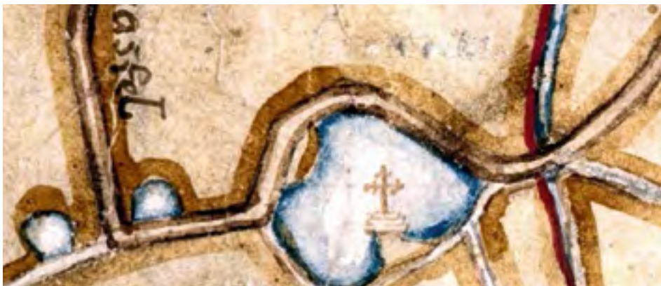
Afb. 5. De Groene Weel (en nog twee weeltjes) op de Gastelse Kaart uit 1565.

de spuiwerking regelde. Het overtollige water van de Verse Vaart kon via een doorgang op het eind van die vaart geloosd worden.