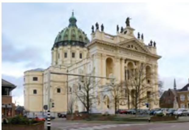
Afb. 1. De basiliek van St. Agatha en Barbara in Oudenbosch (1867-1880). Aan de grijze plint en de trap treden is goed te zien hoe de kerk op de rand van de hoogte van Oudenbosch staat.

Een kilometer ten zuidwesten van de kom ligt nog een dergelijke geïsoleerde hoogte: de Heinsberg, die tot NAP + 5,8 meter hoog