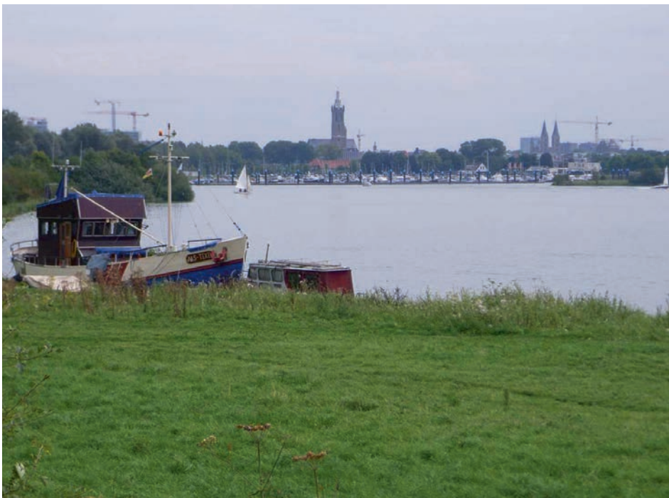
Afb. 4 Een van de Maasplassen bij Roermond. Niets over Limburg in vijftienvijftig jaar Tijdschrift voor Waterstaatsgeschiedenis. De geografische spreiding van artikelen mag beter.

Overzien we de vierde categorie, de amateurs en de studenten, dan valt de grote diversiteit die daarbinnen optreedt in het oog. Onder deze groep scharen zich niet alleen jonge beginnende wetenschappers die hun doctoraal- of masterscriptie presenteren maar ook andere academici waaronder een burgemeester, een theoloog en een arts. Zelfs zien we hoogleraren uit andere takken van wetenschap in het tijdschrift publiceren.