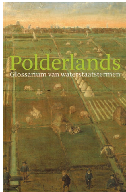
Afb. 3 In 2009 verscheen het Glossarium in boekvorm.

De bibliografie, het zesde wenspunt van de pioniers die aan het begin van het tijdschrift stonden, werd aanvankelijk met de nodige Schwung aangepakt. Verzorgd door Th.P.M. van der Fluit, werkzaam in het Rijksarchief in Noord-Holland (vanaf 2005 het Noord-Hollands Archief genoemd), verscheen tot en met 2006 met regelmaat – in principe elk jaar één aflevering – een overzicht van nieuw verschenen werken op het terrein van de waterstaatsgeschiedenis. Dit betrof met name boeken en artikelen verschenen in publicaties van aanverwante disciplines zoals rechtshistorie, archeologie, hydrografie, economische geschiedenis, landbouwgeschiedenis en historische geografie. Helaas moest men dit waardevolle onderdeel vanaf 2007 afstoten. Het zou wenselijk zijn deze activiteit weer opnieuw op te pakken, want een echt compleet tijdschrift hoort een dergelijke rubriek eigenlijk wel te hebben. Er zullen zich echter waarschijnlijk maar weinigen groepen voelen om deze veeleisende taak, als vrijwilliger naast de eigen betaalde werkzaamheden, op zich te nemen.